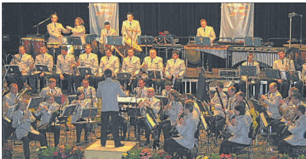
Breitgefächertes Repertoire: Das Heeresmusikkorps 2 aus Kassel spielte eine beschwingte Mischung unterschiedlicher Musikstile.

Der Rotary-Club möchte mit den Erlösen aus dem Konzert vier Veranstaltungen, unter anderem in Bad Wildungen ausrichten, die eine gesündere Ernährung von Kindergarten- und Grundschulkindern fördern. Kinder sollen dabei gemeinsam mit einem Koch lernen, ein gesundes Frühstück selbst zuzubereiten. Namhafte Sportler aus der Region werden die Aktion durch ihre Teilnahme unterstützen, heißt es vom Club weiter. (nh)